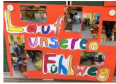
Plan für einen Glücksweg