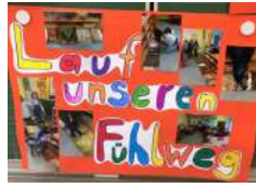
Plan für einen Glücksweg