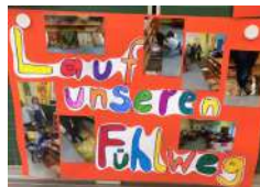
Plan für einen Glücksweg